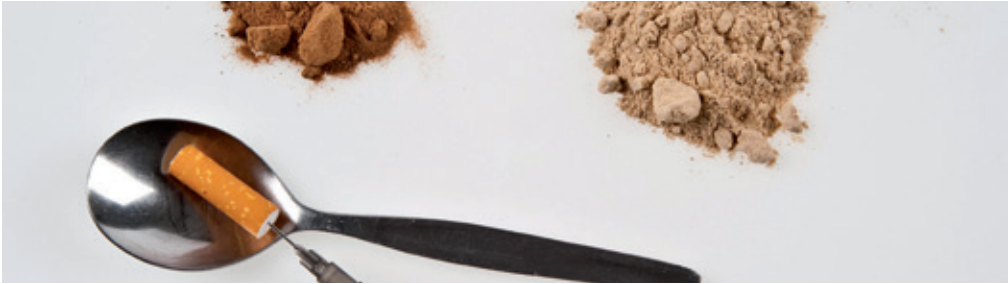
^ Heroin in Pulverform, Konsumentenutensilien (Löffel, Zigarettenfilter, Spritze)