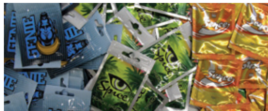
^ NpS in Form von Kräutermischungen

Bunte Verpackungen und kreative Bezeichnungen sollen einen harmlosen Eindruck der NpS vermitteln. Das Gesundheitsrisiko ist damit jedoch unkalkulierbar. Auf den Verpackungen werden Inhaltsstoffe meistens nicht oder falsch angegeben. Neben NpS sind darin auch andere Betäubungsmittel enthalten. Zudem werden die Inhaltsstoffe eines Produkts im Laufe der Zeit immer wieder verändert, so dass bei wiederholtem Konsum einer bestimmten Mischung nicht mit der gleichen Wirkung zu rechnen ist.