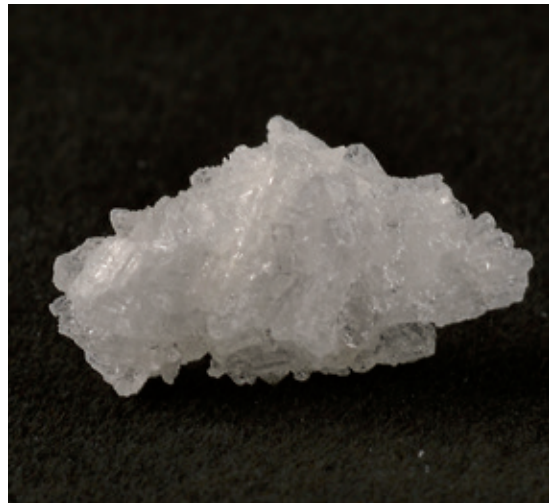
^ Kristallines Methamphetamin („Crystal Meth“) in typischer Erscheinungsform