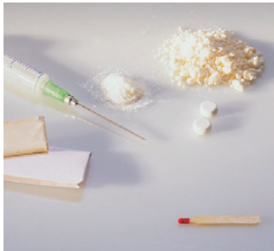
^ Amphetamin als weißes Pulver und in Tablettenform