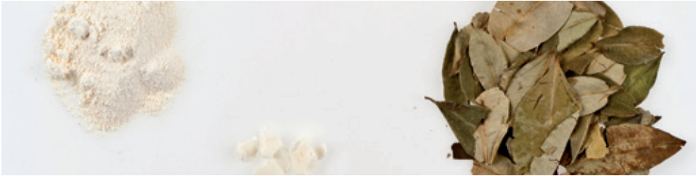
^ Links: Kokain, Mitte: Crack, rechts: Kokablätter