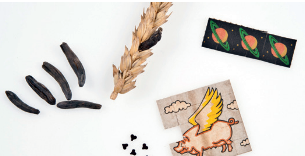
◀ Links: Mutterkorn, rechts: „Trips“ (mit LSD beträufelte Briefmarken)